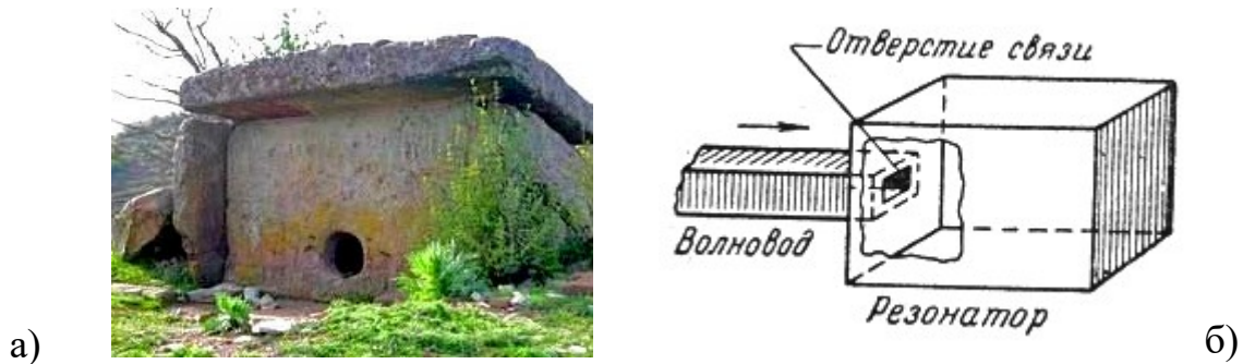
Рис. 1. Сравнение дольмена – а) с объемным резонатором – б) www.google.ru