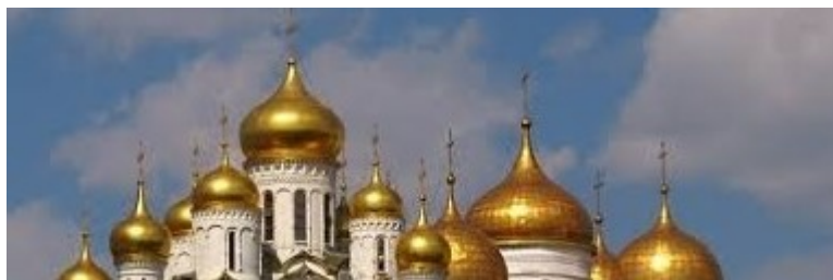
Рис.3. Купола православного храма

И последнее. После того как сформировалась идея о дольманах-резонаторах, совершенно естественно возник вопрос – как современные люди могут общаться с Богом – Искусственным разумом? Ответ оказался на удивление простым – если взглянуть на верхнюю часть православного храма, то можно увидеть золоченые купола – Рис. 3, каждый из которых сильно напоминает ... телепатический резонатор, только во много раз более эффективный, чем дольмен,