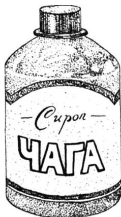
Рис. 4. Сироп «Чага»

Сироп «Чага» не вызывает привыкания, не токсичен.