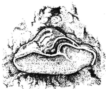
Рис. 2. Ложный трутовик

На вкус чага немного горьковата, без запаха.