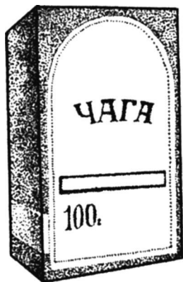
Рис. 5. Лекарственное сырье «Чага»

Способ применения и дозы: Капсулы: взрослым и детям старше 12 лет назначают по 1-2 капсуле 2-3 раза в день во время еды, запивая 1 стаканом кипяченой воды.