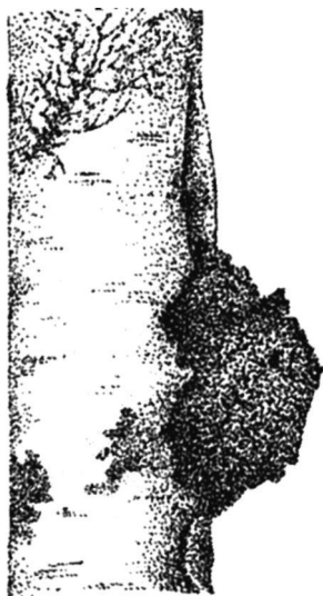
Рис. 1. Березовый гриб чага

Образование гриба происходит следующим образом: грибные споры проникают в древесину, постепенно ее разрушая. В месте первоначального проникновения спор (чаще всего это нижняя и средняя части стволов) развивается нарост, выступающий из-под коры, которая вследствие этого разрывается. Гриб вызывает на березе белую сердцевинную гниль, подобную той, которую образует на деревьях ложный трутовик. Именно поэтому на протяжении нескольких десятилетий чага считалась бесплодной формой ложного трутовика. Настоящие плодовые