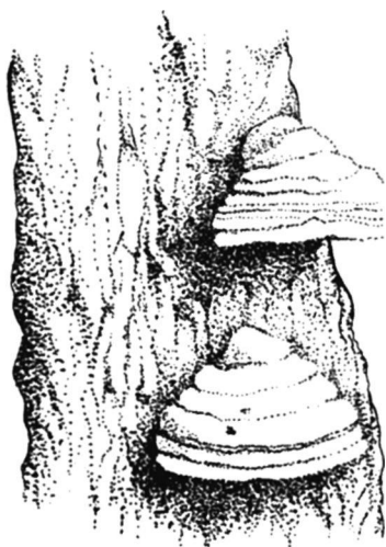
Рис. 3. Настоящий трутовик