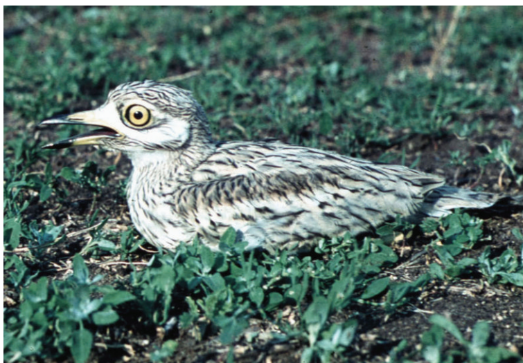
Авдотка на гнезде. 5 мая 1998 г. Краснокутский район (окрестности с. Дьяковка)