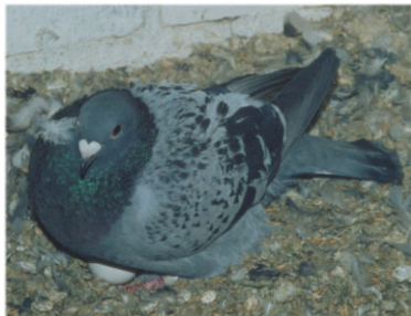
Сизый голубь на гнезде. 23 марта 2002 г. НИИ СХ Юго-Востока, г. Саратов