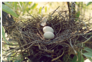
Кладка вяхиря. 14 июня 2003 г. Новобурасский район (окрестности с. Аряш)