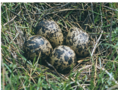
Кладка чибиса. 9 мая 2002 г. Краснокутский район (окрестности с. Дьяковки)