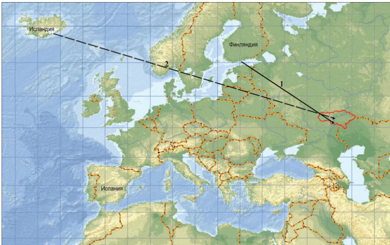
Размещение возвратов большого поморника (1) и чистика (2) с территории Саратовской области по данным кольцевания (географическую привязку см. в тексте)