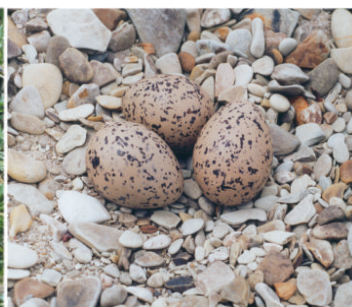
Кладка кулика-сороки. 9 мая 2003 г. Воскресенский район (окрестности с. Комаровки, пойма р. Терешки)