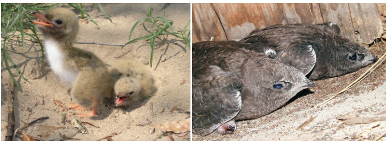
Птенцы озерной чайки. 18 июля 2004 г. Окрестности с. Пристаное (Саратовский район)