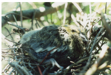
Птенец вяхиря. 12 июля 2002 г. Новобурасский район (окрестности с. Радищево)