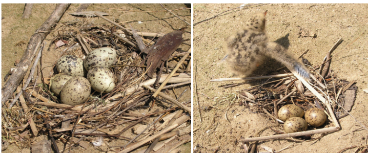
Размножение озерной чайки. 18 июля 2004 г. Окрестности г. Саратова, волжский остров