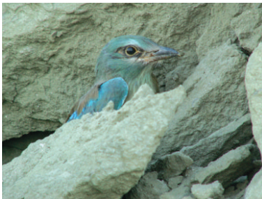
Сизоворонка первого года жизни. 14 июля 2006 г. Красноармейский район (окрестности с. Н. Банновки)