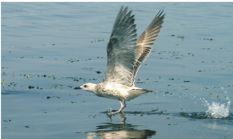
Хохотунья (особь первого года жизни). 28 августа 2004 г. Окрестности г. Саратова, р. Волга